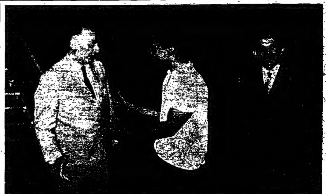
جلالة الملك المفدى يستقبل من منحة دولة الرئيس القاتوني لدى وصوله عمان امس - وقد صادف وصول طائرة الرئيس بيجت من بيروت الى عمان في الساعة السادسة والنصف صباحاً في مطار عمان الدولي

الأمم المتحدة - رويترز - أقر مجلس الأمن الدولي بالاجماع ليلة امس مشروع قرار يندد بهجوم إسرائيل الجوي على امدان في الاردن في الرابع من اب الحالي ويحذر من مضاعفات مثل هذا العمل